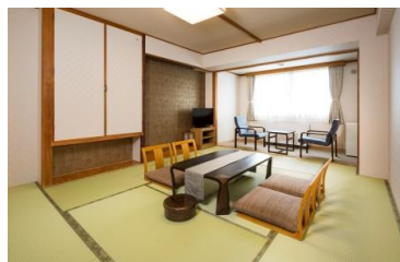
一般客室(10畳スタンダード)

夕食:ゆもと膳(基本膳) 料理ランクアップ:華膳 追加料金お一人様2,500円 料理ランクアップ:笑福膳 追加料金 お一人様4,900円