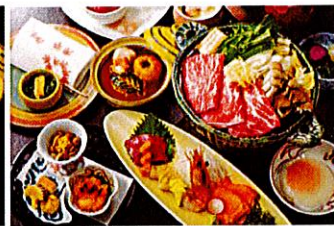
料理ランクアップ：笑福御膳