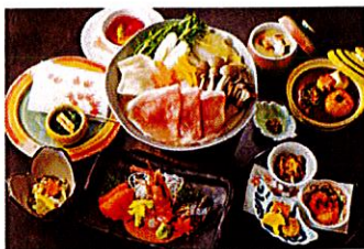
夕食：ゆもと膳（基本膳）

◆設定除外日：10月6日~7日、10月19日~20日、10月22日、10月28日、 11月10日、11月12日、11月16日、12月25日~1月3日、 1月20日~22日、1月25日~27日、2月17日