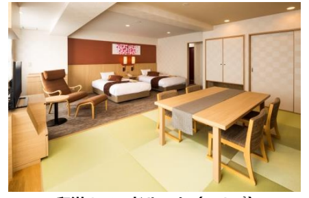
和洋2ベッドルーム(48㎡)