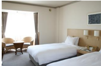
スタンダードツイン