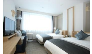
コンフォートツイン