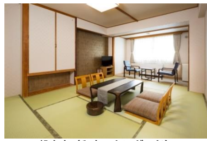
一般客室(和室スタンダード)