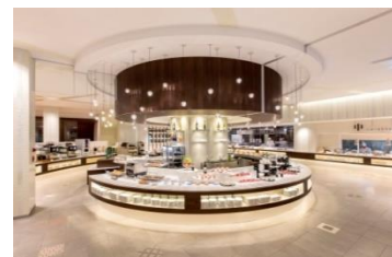
レストランせせらぎ