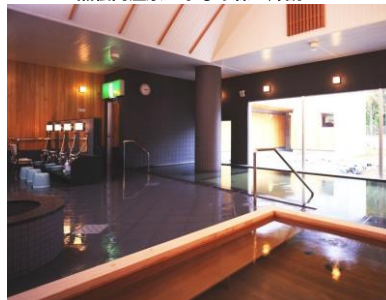
黒松内温泉 ぶなの森