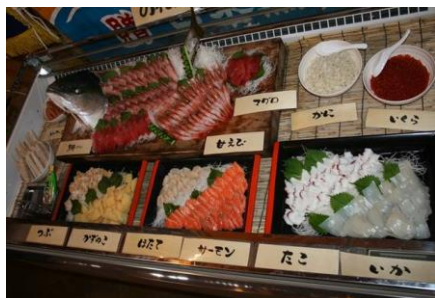
スツツ・オイスター・ピレッジ 海鮮ビュッフェ食べ放題

■ぶなの森の泉質はアルカリ性単純温泉 (開放感のある、ゆったりとしたお風呂でのんびり休憩)