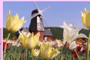
上湧別 かみゆうべつチューリップ公園