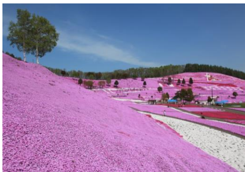
東藻琴 ひがしもこと芝桜公園