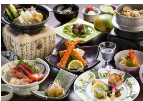
ホテル網走湖荘 夕食: いさり火膳