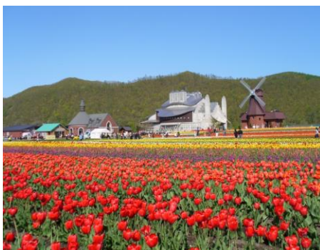
上湧別 かみゆうべつチューリップ公園