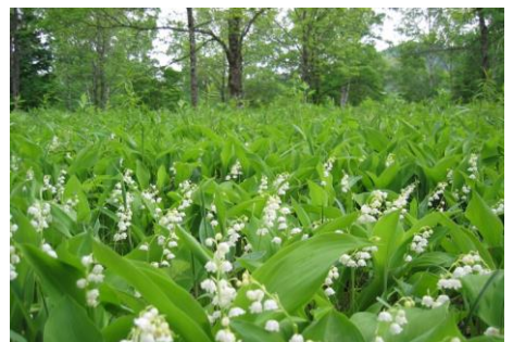
平取町 芽生 すずらん群生地