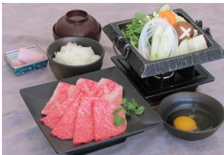
びらとり和牛 ロースすき焼き御膳