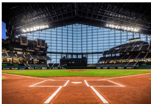
エスコンフィールドHOKKAIDO