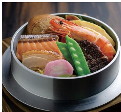
旬のお料理「釜飯いちえ」いちえごもく釜めし(イメージ)