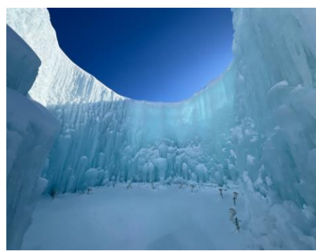
千歳・支笏湖氷濤まつり(イメージ)

*本パンフレットをご出発前にお渡しする最終日程案内書に代えさせていただきます。*