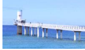
ブセナ海中公園 海中展望塔