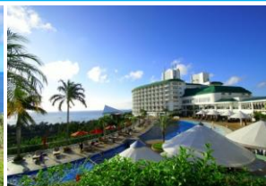
沖縄かりゆしビーチリゾート・オーシャンスパ