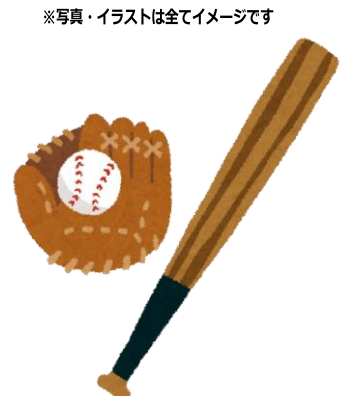
※写真・イラストは全てイメージです