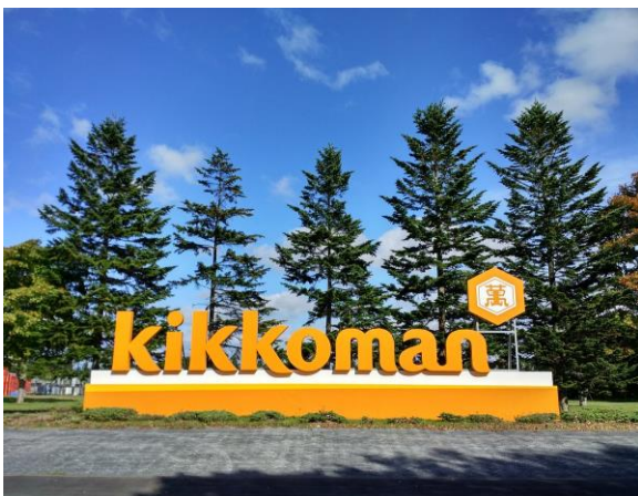
北海道キッコーマン株式会社