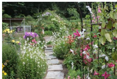
花工房あや ガーデン