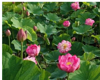
花工房あや (蓮の花)