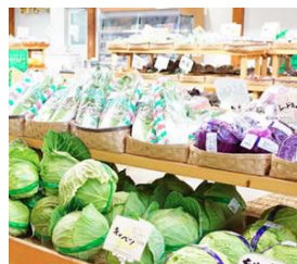
ホクレンくるるの杜 農畜産物直売所