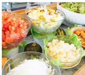
ホクレンくるるの杜 ランチビュッフェ