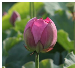
花工房あや 蓮(ハス)の花

※乗降場所のバス停：路線バスの運行上、バス停付近での乗降となります。多少のご移動をお願いする場合がございますので予めご了承ください。