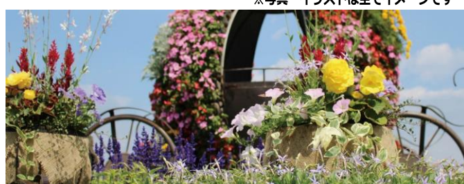
はなの拠点「はなふる」