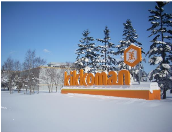
北海道キッコーマン株式会社