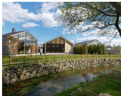
ドレモルタオ外観