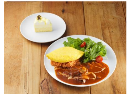
ビーフストロガノフオムライス & ドゥーブルフロマージュ ※アレルギー等でお肉を召し上がれない方へは別メニューを ご案内いたします