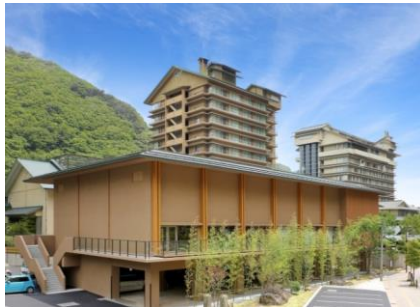
ぶくしま磐梯熱海温泉ホテル華の湯 外観