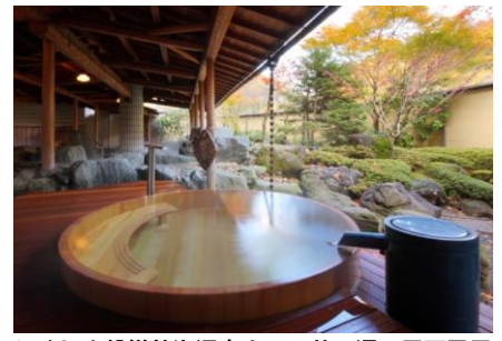
ぶくしま磐梯熱海温泉ホテル華の湯 露天風呂