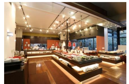
ホテルサンバレー那須 レストラン