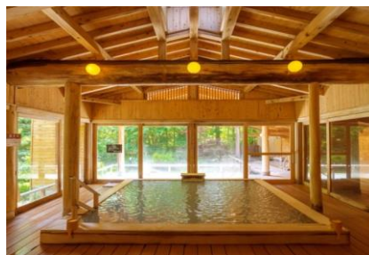
ホテルサンバレー那須 大浴場