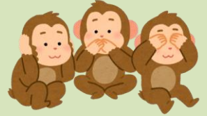
※写真・イラストは全てイメージです