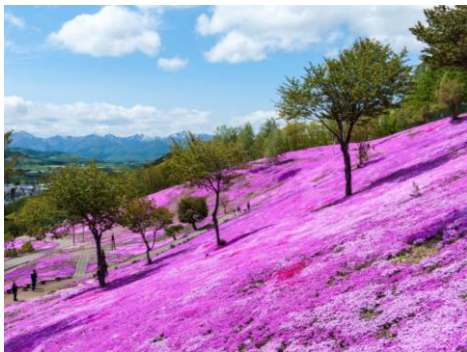
滝上 芝ざくら滝上公園