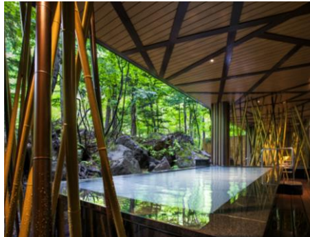
朝陽リゾートホテル 風呂