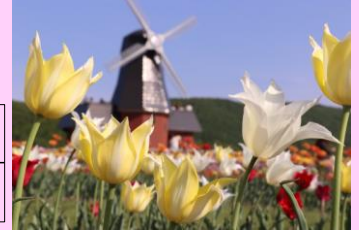
上湧別 かみゆうべつチューリップ公園