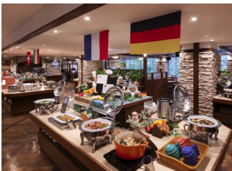
朝陽リゾートホテル 夕食