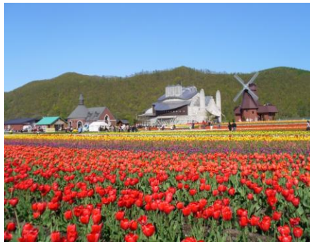
上湧別 かみゆうべつチューリップ公園