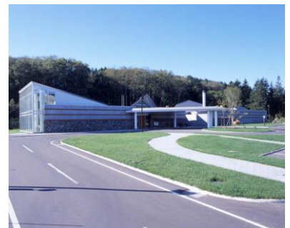
黒松内温泉 ぶなの森 外観