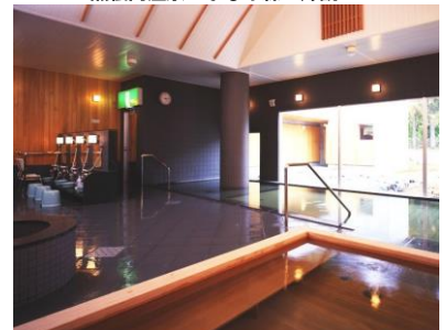
黒松内温泉 ぶなの森