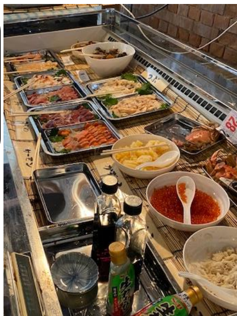
スツツ・オイスター・ピレッジ 海鮮食べ放題

ぶなの森の泉質はアルカリ性単純温泉 (開放感のある、ゆったりとしたお風呂でのんびり休憩♪)