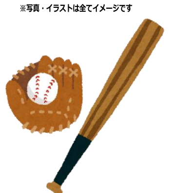
※写真・イラストは全てイメージです